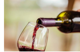
VOLLE PRIMITIVO-POWER VORAUS: DIE TREND-REBSORTE AUS ITALIEN ZUM ANGEBOT >

Ob man im Sommer lieber in die Berge oder ans Meer fährt, ist eine Glaubensfrage. Wer keine Lust auf einen weiteren quälenden Hitzesommer hat, ist mit seiner Familie sowohl im Kandima Maldives als auch im SPA-Hotel Jagdhof im Stubaital gut aufgehoben.